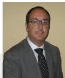
avv. Guglielmo Camera Studio Legale Camera Verneti