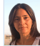
avv. Simona Coppola Studio Legale Garbarino Vergani