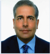
avv. Giancarlo Soave Studio Legale Soave